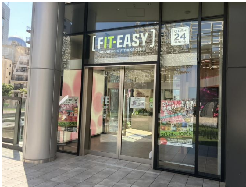
FIT-EASY 渋谷店（東京都渋谷区）

全国にアミューズメントフィットネスクラブを展開するフィットイージー株式会社（本社：岐阜市）は、東京都渋谷区に旗艦店となる「FIT-EASY 渋谷店」を 2025 年 7 月 24 日（木）にプレオープンいたしました。（グランドオープン：8 月 5 日）