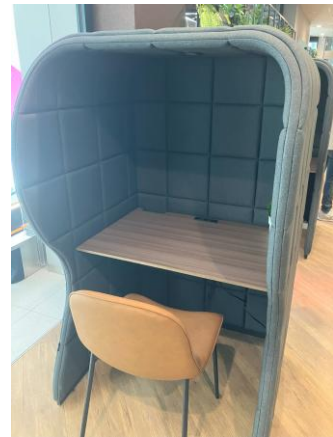
渋谷店に導入している 半個室の FIT-LOUNGE