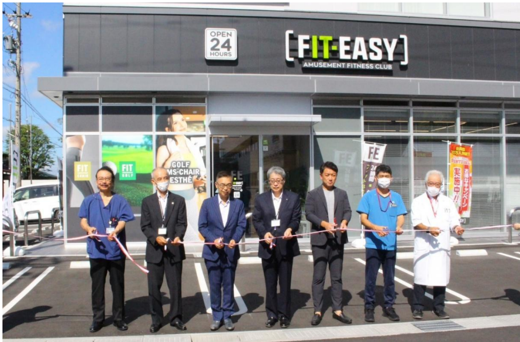
式典内で行われたテープカットの様子

オープンにあたり、地域関係者や病院関係者による式典が執り行われ、多くの祝意のもと、メディカルフィットネスクラブとしての新たなスタートを切りました。