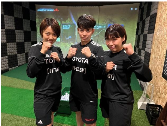
2024年11月 千種店でのイベント