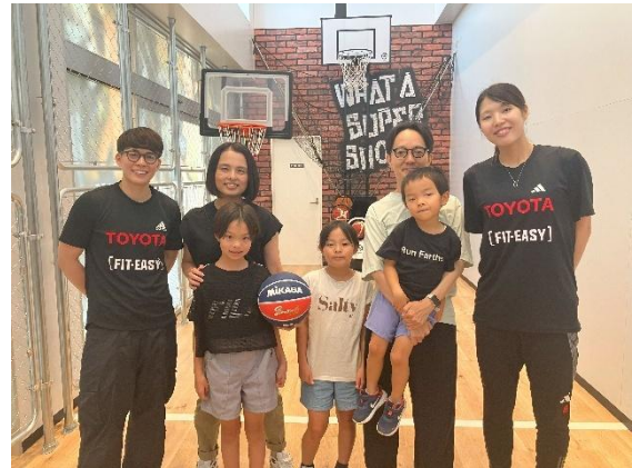
2025年8月 高浜店でのイベント